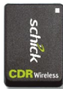
senzory v originální velikosti